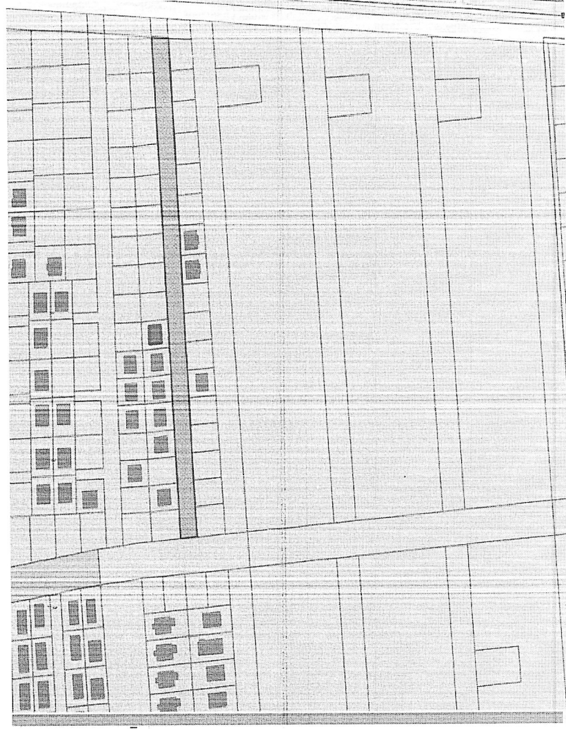
Схема расположения элемента улично-дорожной сети

Приложение к постановлению администрации Южно-Кубанского сельского поселения Динского муниципального района Краснодарского края от 06.08.2025 № 480